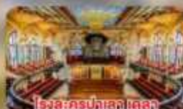
โรงละครปลาลา เดลา บูลีก้า คาตาลาซา