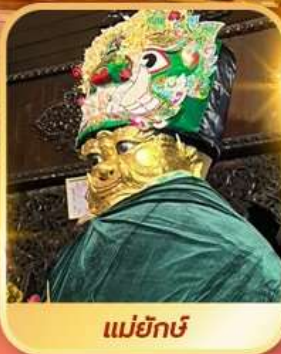
แม่ยักษ์