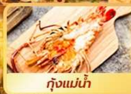
กุ้งแม่น้ำ