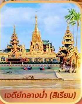
เจดีย์กลางน้ำ (สิริเยม)