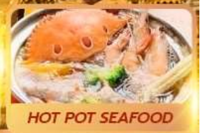
HOT POT SEAFOOD