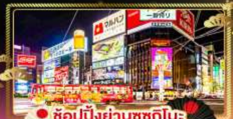
• ช้อปปิ้งย่านซุกุชิโนะ