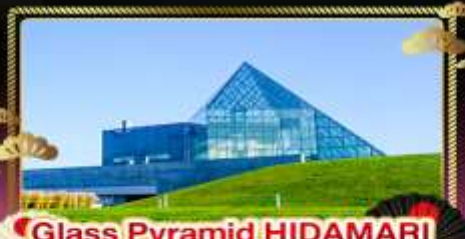
• Glass Pyramid HIDAMARI