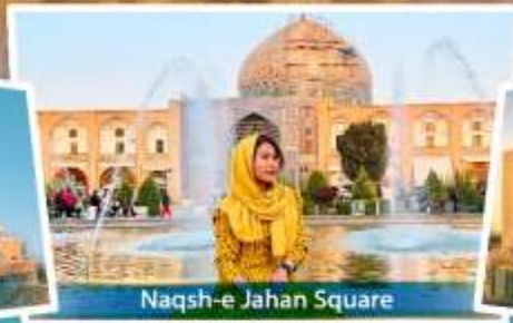
Naqsh-e Jahan Square