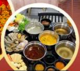
ชาบูฮ่องกง