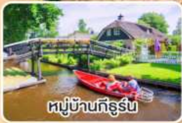
หมู่บ้านทีร์ูร์น