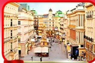
ย่านคาร์กเนออสตรีก