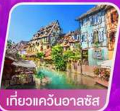
เที่ยวแคว้นอาลซัส