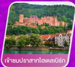
เข้าชมปราสาทไฮเดลเบิร์ก