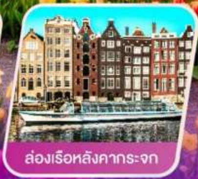
ล่องเรือหลังคากระจุก