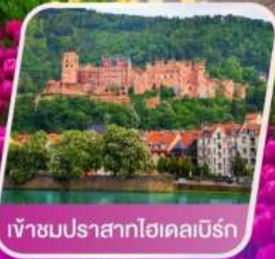
เข้าชมปราสาทไฮเคลมเบิร์ก