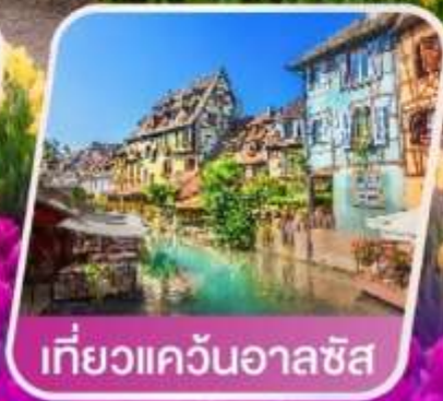
เที่ยวแคว้นอาลซัส