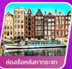
ส่องเรือสิงคารถะจก

เที่ยวเทศกาลดอกไม้เคอเคนฮอฟ ชมแคว้นอาลซัส หมู่บ้านสวยที่สุดในฝรั่งเศส เยือนเมืองมรดกโลก