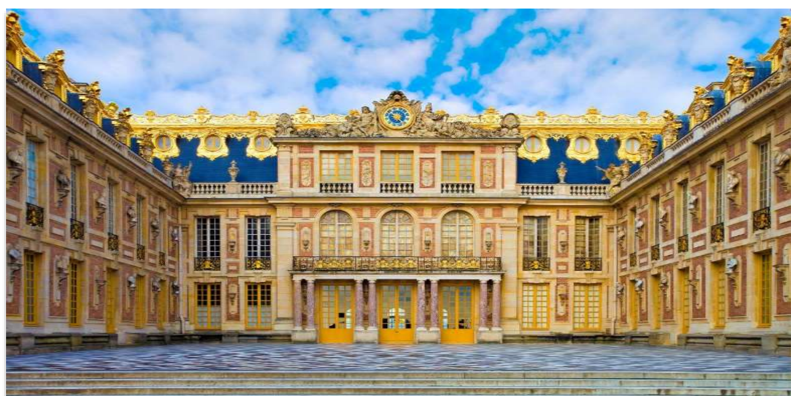
CHÂTEAU DE VERSAILLES

จากนั้นนำท่านเข้าชมความงดงามของ “พระราชวังแวร์ซายส์” (Palace of Versailles) หนึ่งในสถานที่สำคัญทางประวัติศาสตร์และวัฒนธรรมของประเทศฝรั่งเศส ซึ่งได้รับการขึ้นทะเบียนเป็น มรดกโลกโดยองค์การยูเนสโก และได้รับการยกย่องให้เป็น หนึ่งในเจ็ดสิ่งมหัศจรรย์ของโลกยุคใหม่ ด้วยความยิ่งใหญ่