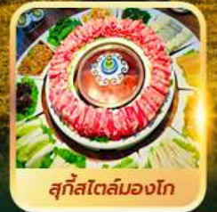
สุกีสโตลมองโก