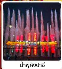
น้ำพุคังปาซี

● ไอลัก เป็นสายการบินแห่งชาติ แพลตฟอร์มเที่ยวระดับ 5A ของจีน ภูเขาไฟอูลันฮาตา น้ำพุคังปาซี น้ำพุที่สูงที่สุดในเอเชีย