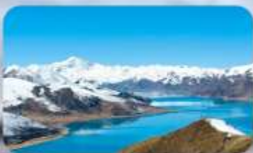
ทะเลสาบยิมครก