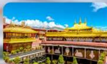
วัดโจกิง