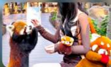
ให้อาหารแพนด้าแดง