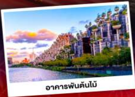
อาคารพันต้นไม้