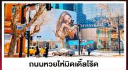
ถนนหยอไห่มีดเคิลโรด