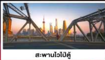
สะพานไวปู้ตู่