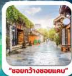
"ชอยกว้างชอยแคบ"