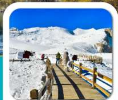
"ต่ากุกลาเชียร์"

เที่ยวชมความงาม 3 อุทยานชื่อดัง : สีดรุณี • ปี่เผิงโกว ต่ากุกลาเชียร์ ชมความน่ารักของหมีแพนด้า • จัตุรัสหยางเทียนวู่ ชอยกว้างชอยแคบ • ถนนคนเดินซุนซีลู่ • POP MART