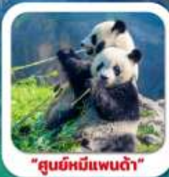
"ศูนย์หมีแพนด้า"