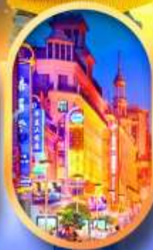
ถนนหนานกิง