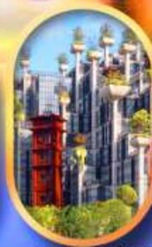
อาคาร 1,000 คับไม้