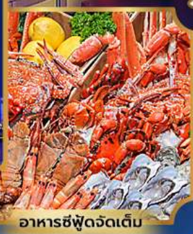
อาหารซีฟู้ดจัดเต็ม

บุฟเฟ่ต์เบียร์ไม่อื่น + ซีฟู้ด + ปิ้งย่างเกาหลี