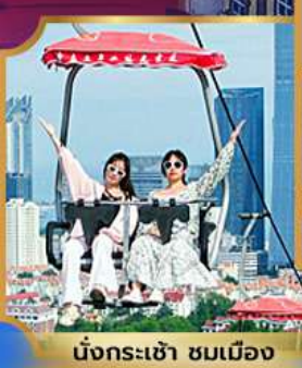
นั่งกระเช้า ชมเมือง