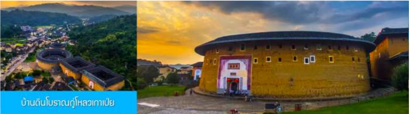
บ้านดินโบราณกุ๋โหลวกาเปย์

เจิงฉีโหลว หู่หยุนโหลว ซื่อเจ้อโหลว ฯลฯ ได้รับสมญานามว่าเป็น ราชาแห่งบ้านดิน กลุ่มบ้านดินหลายหลังนี้เป็นบ้านพักอาศัยของชาวจีนและตระกูลเจียง 江氏 นำท่านเที่ยวชม บ้านดินเจิงฉีโหลว 承启楼