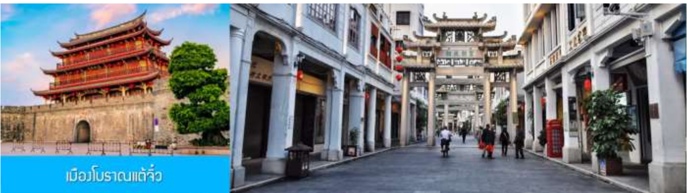
เมืองโบราณเต๋อจิว

พักที่ โรงแรม HAKKA TULOU PRINCE HOTEL 4* หรือเทียบเท่าในเมืองหย่งตั้ง