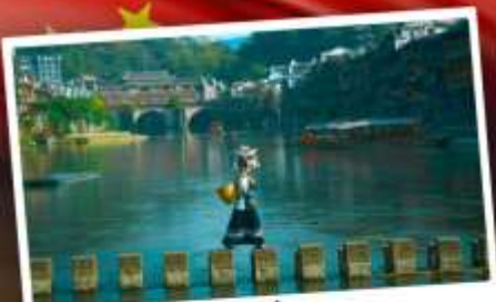
หมู่บ้านเฟิ่งทง

สุดคุ้ม!! พัก 5 ดาว ทุกคืน มนตร์เสน่ห์เมืองเก่า ริมสาងน้ำแจ่มใสแสน