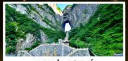
ทิวเขาประตูสวรรค์