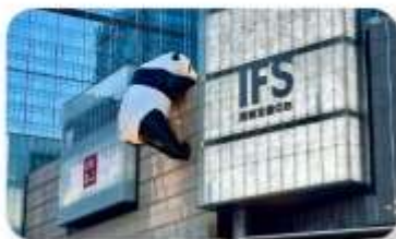
แพนด้าป็นตัก IFS