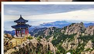
ภูเขาเหลาซาน