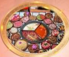
บุฟเฟต์หม้อไฟลงซิ่ง