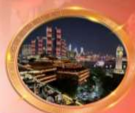
มือทำร้านอาหารวิวหลักล้าน