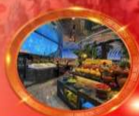
มือพิเศษ บุฟเฟต์นานาชาติ