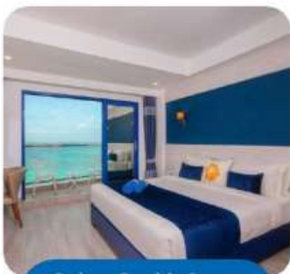
Deluxe Double Room Seaview with Balcony