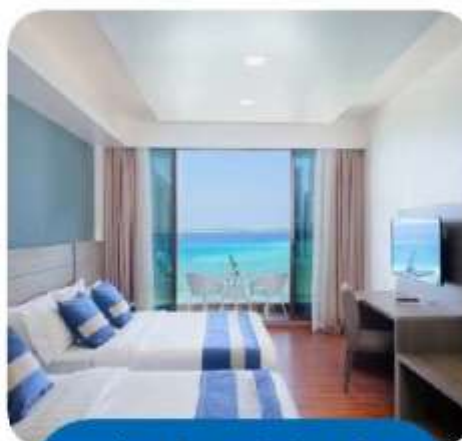
Premium Super Deluxe Room with Balcony and Seaview