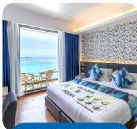
Premium Double Room with Balcony and Seaview