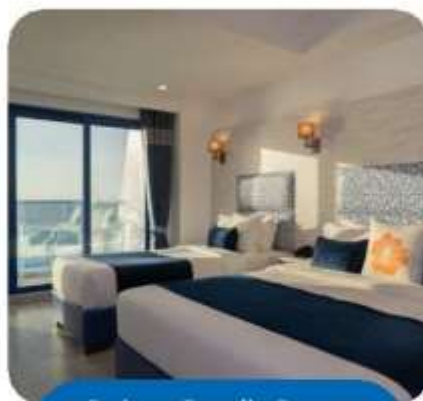
Deluxe Family Room Seaview with Balcony